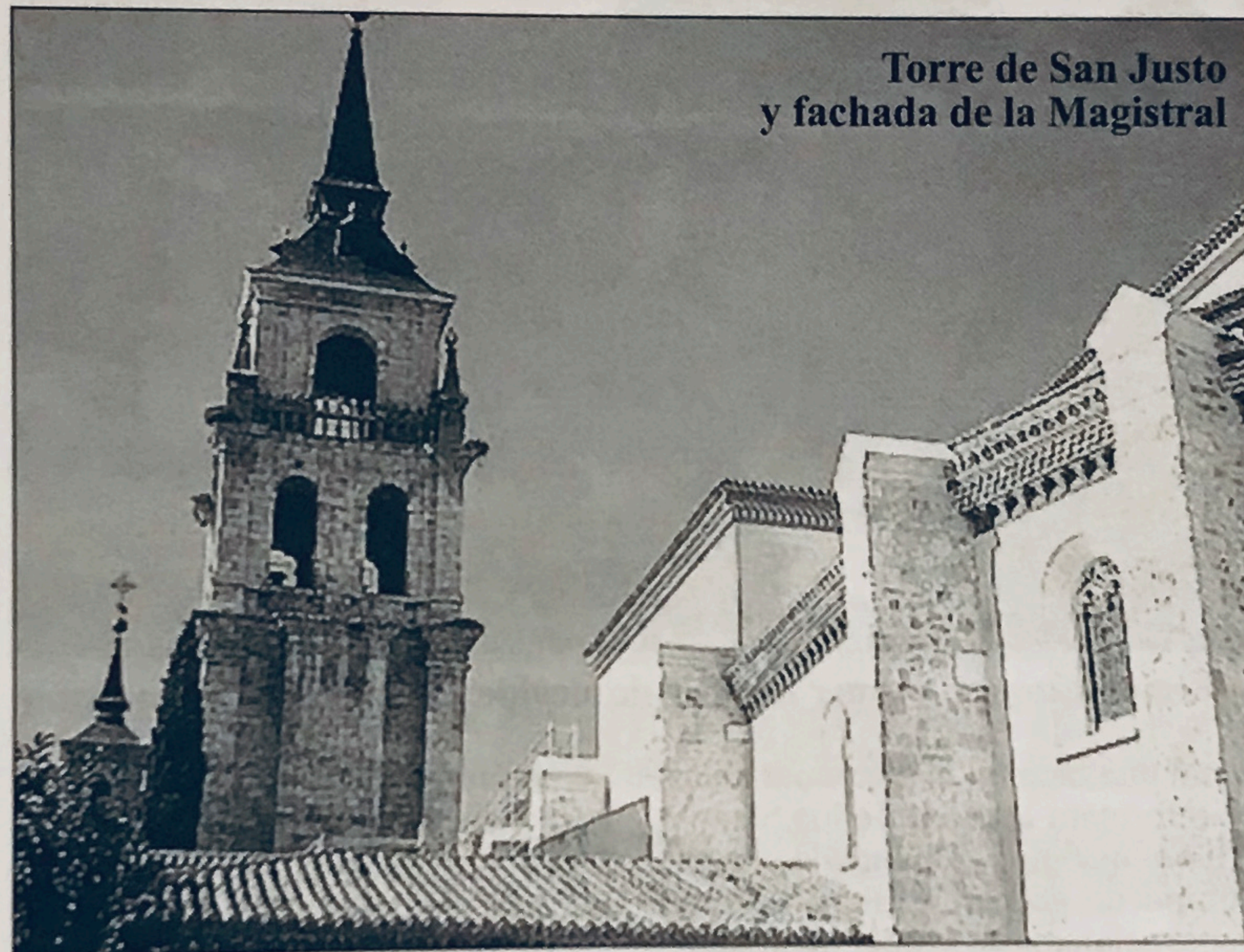
Torre de San Justo y fachada de la Magistral