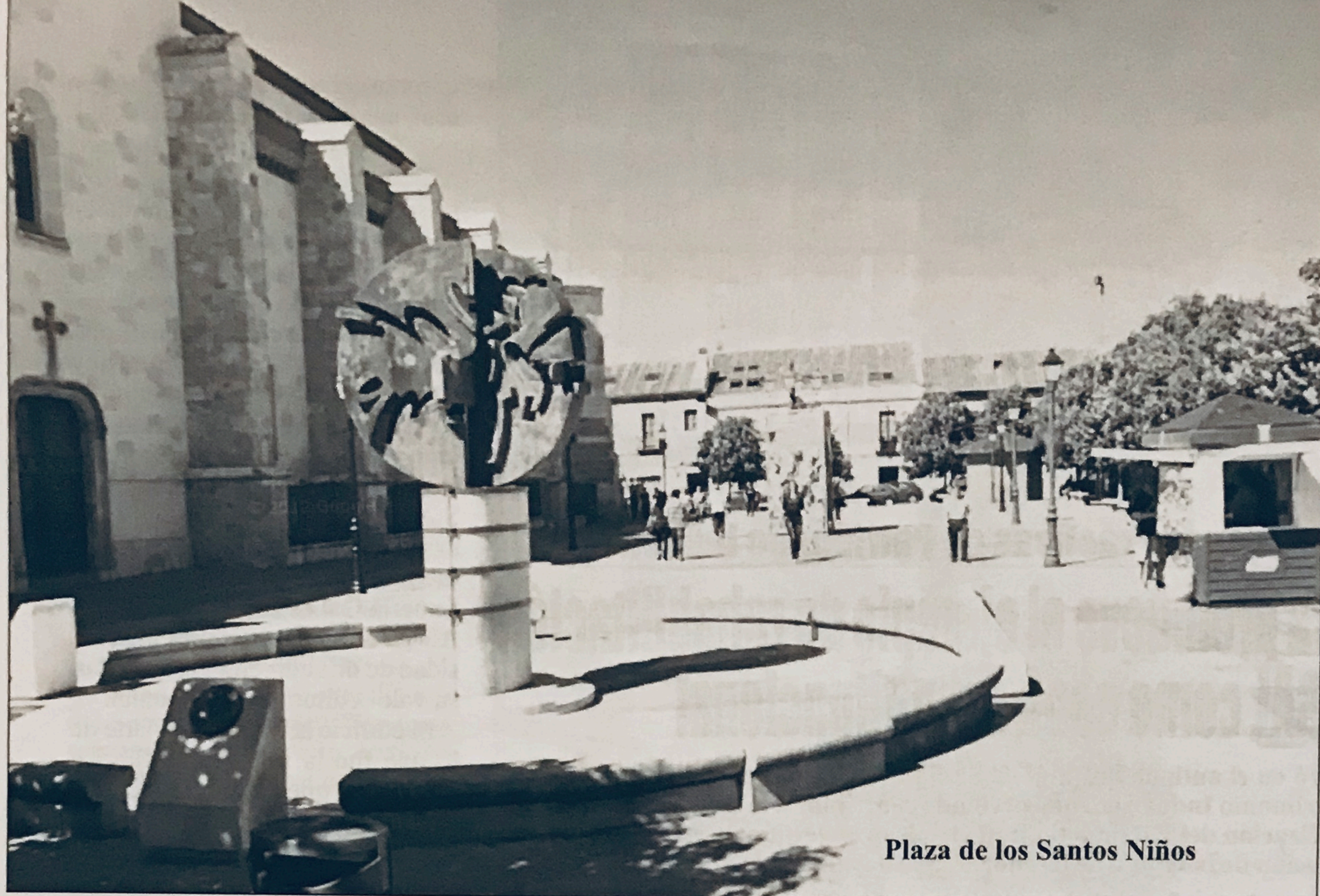
Plaza de los Santos Niños