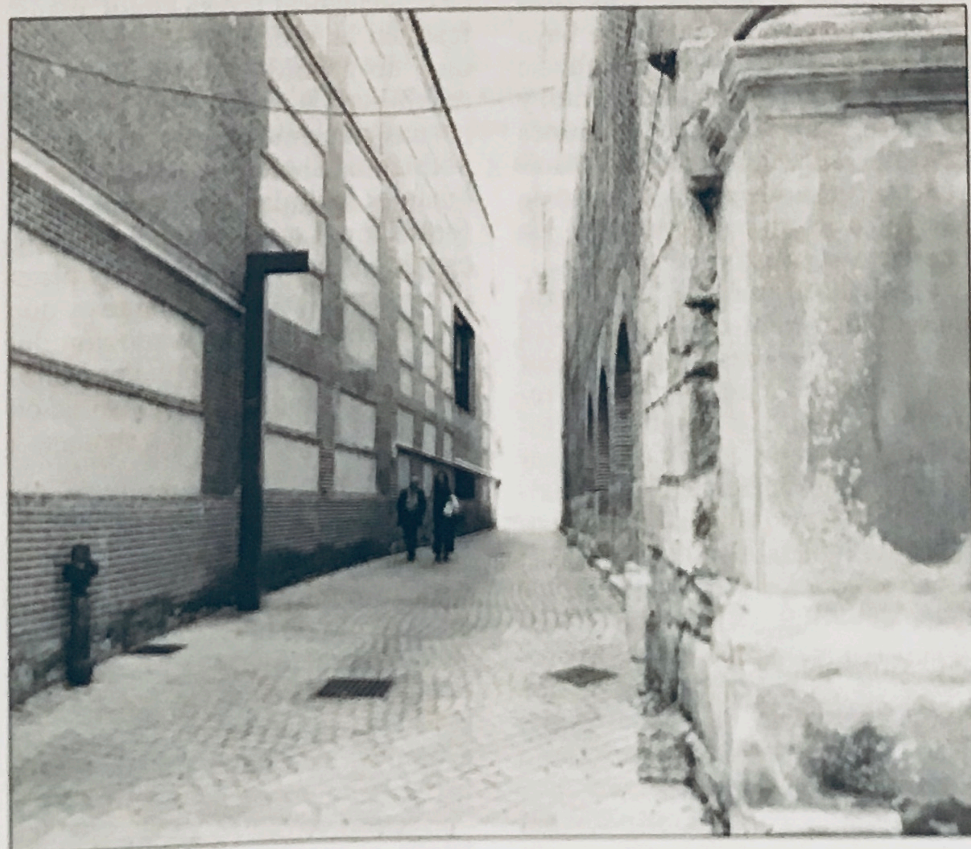
Callejón de las Santas Formas