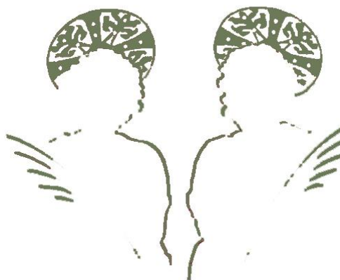
SANTOS NIÑOS JUSTO Y PASTOR

Obispado de Alcalá de Henares Secretaría Plaza de Palacio nº 1 bis 28801 Alcalá de Henares Tels.: 918882700 E_mail: diocesis@obispadoalcala.org